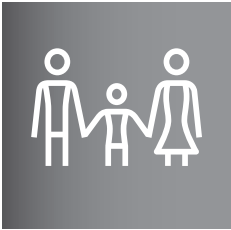
Tabela invalidnosti za določanje trajne izgube splošne delovne sposobnosti zaradi nezgode

Skladno s 25. členom splošnih pogojev za nezgodno zavarovanje je Tabela invalidnosti za določanje trajne izgube splošne delovne sposobnosti zaradi nezgode (v nadaljnjem tekstu: tabela) sestavni del splošnih pogojev in vsake posamezne pogodbe o nezgodnem zavarovanju.